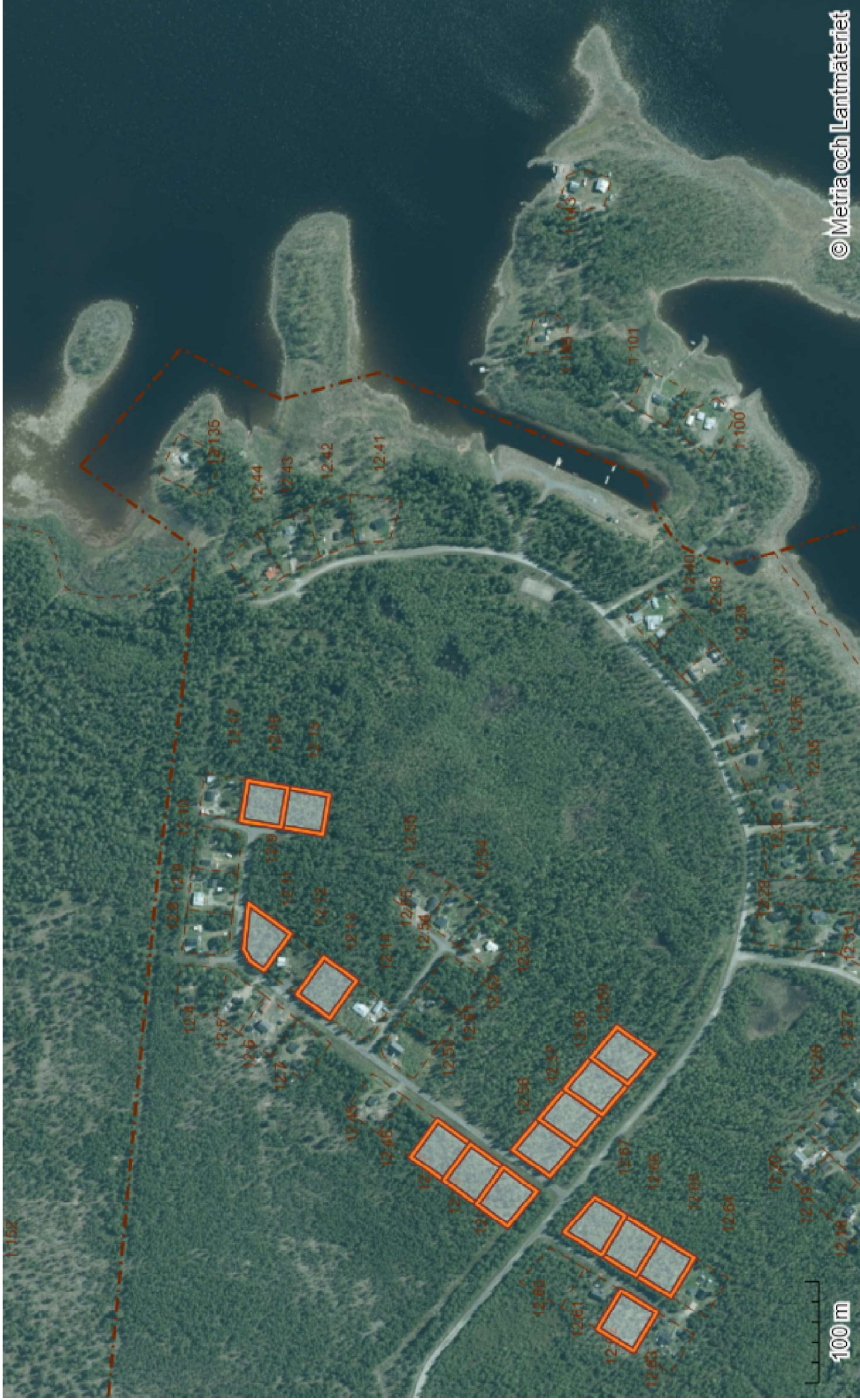
Fastighetsgränserna är ej juridiskt bindande