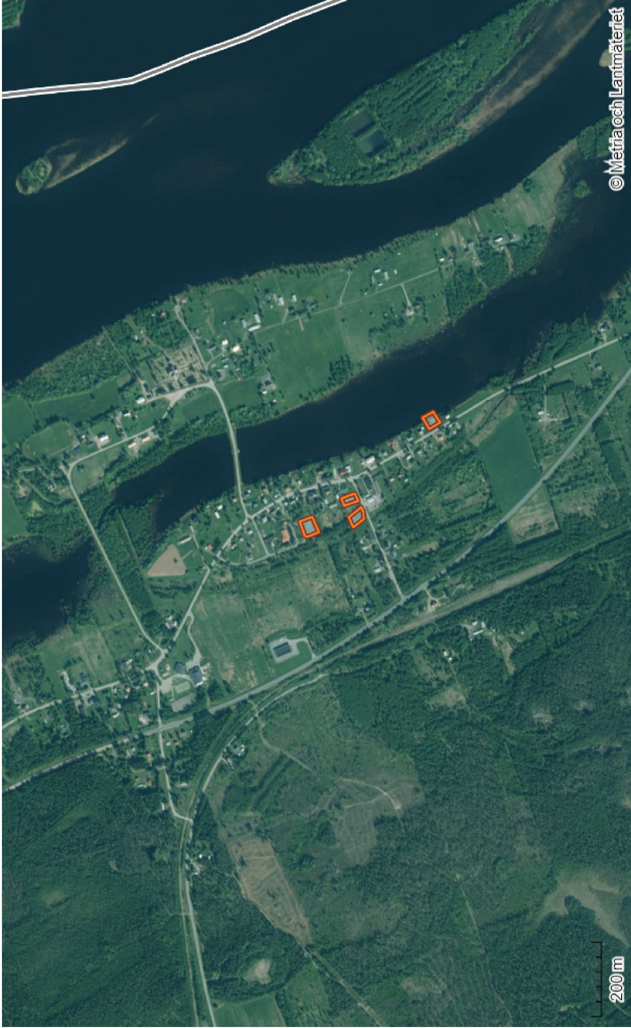
Fastighetsgränserna är ej juridiskt bindande