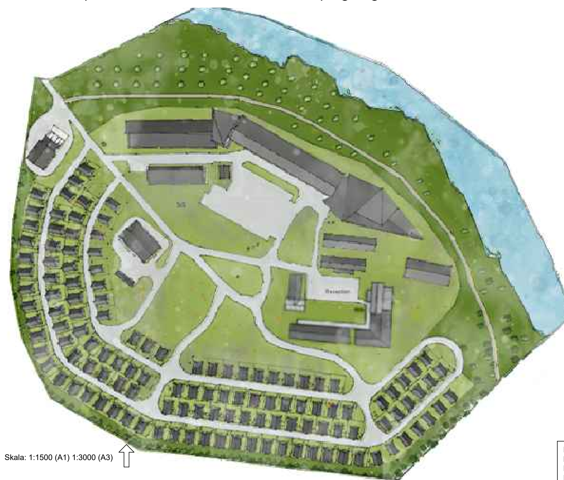
Skala: 1:1500 (A1) 1:3000 (A3)