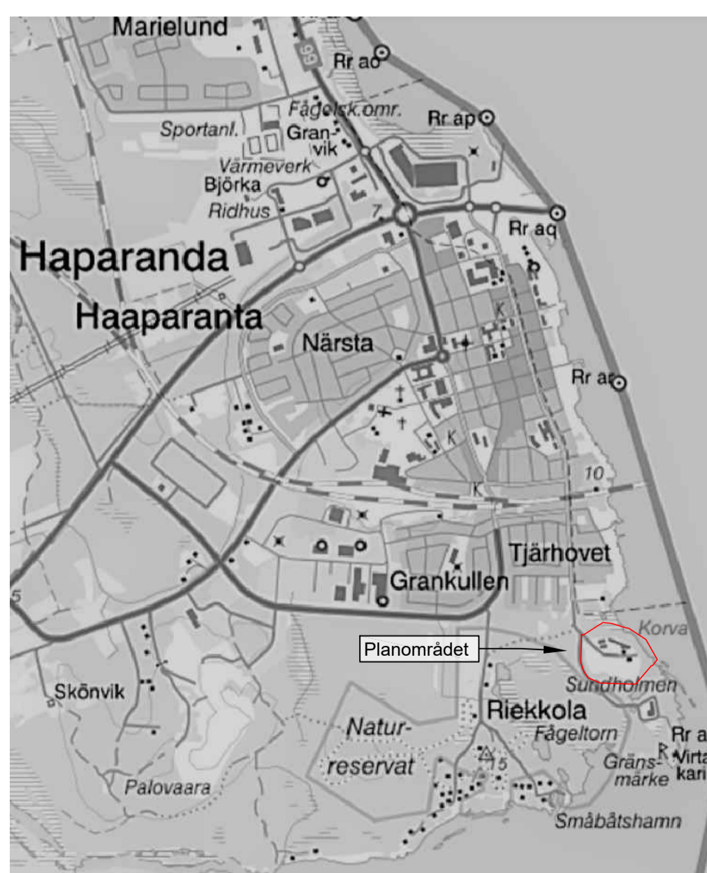
Skala: 1:1500 (A1) 1:3000 (A3)