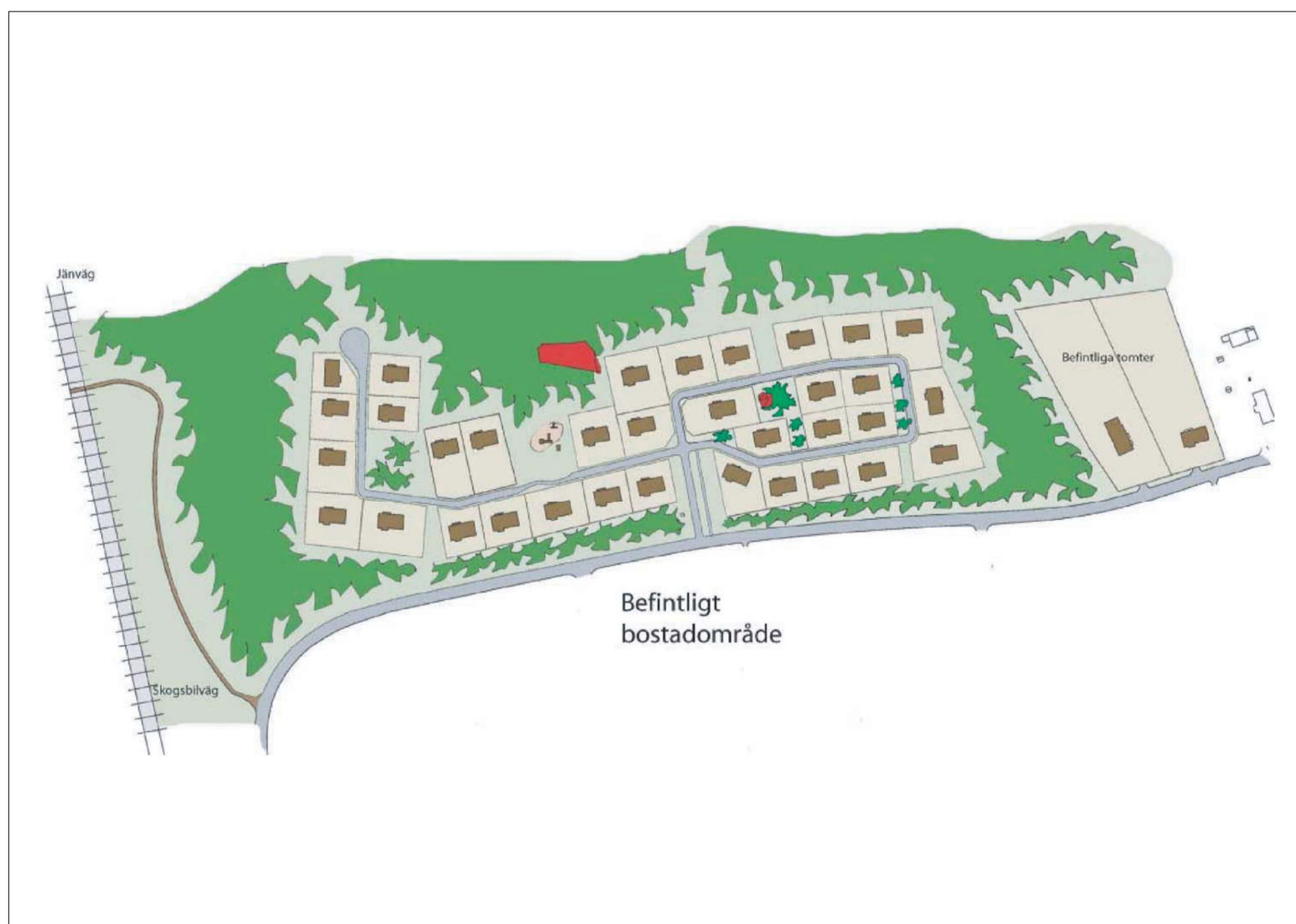
ILLUSTRATION Skala 1:4000