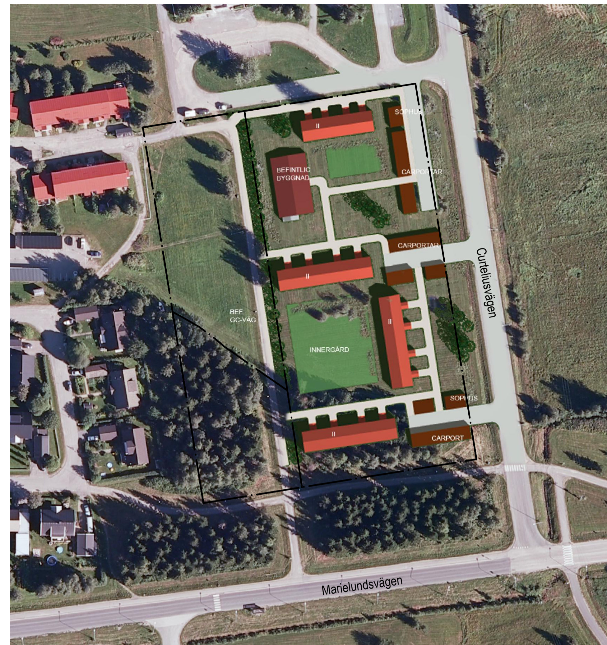
Illustration baserad på skiss upprättad av Sven-Erik Pohjanen, Sven-Erik Pohjanen arkitektkontor AB.