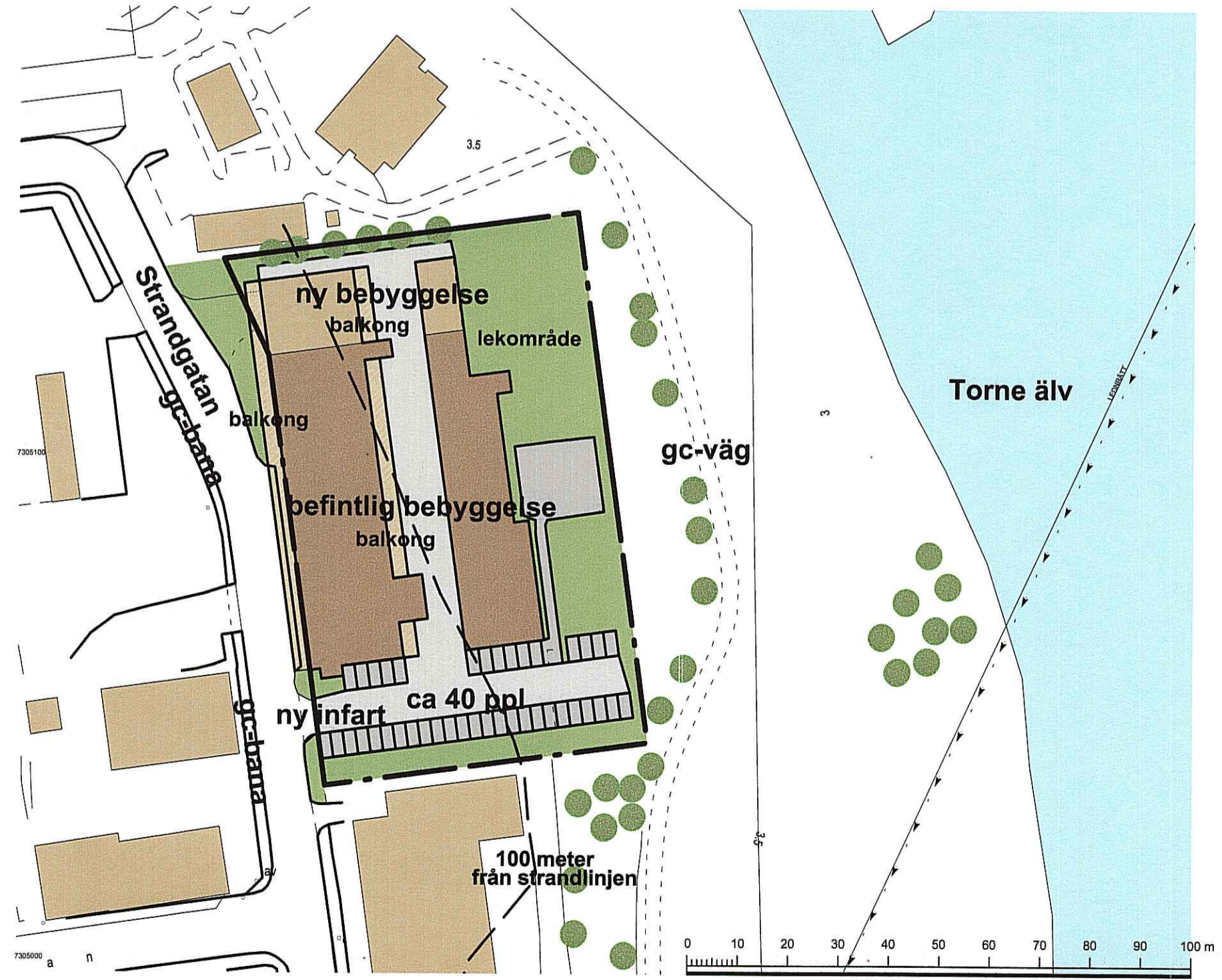
Skala: 1:1000 (A1) 1:2000 (A3)