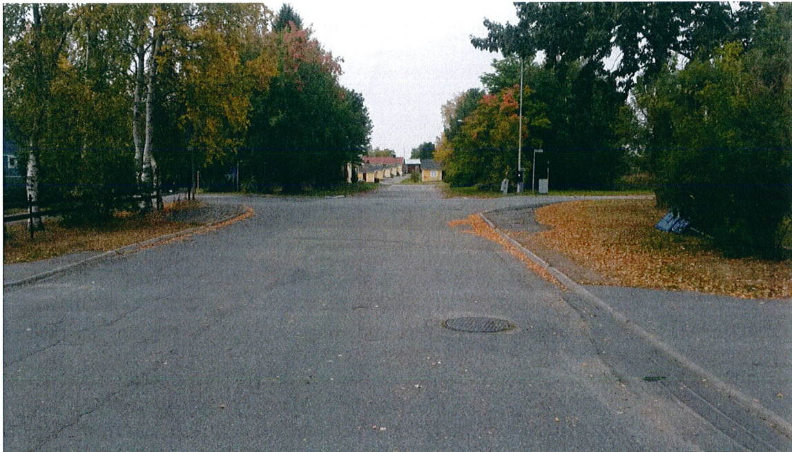
Bryggargränd mot väster och korsningen med Storgatan