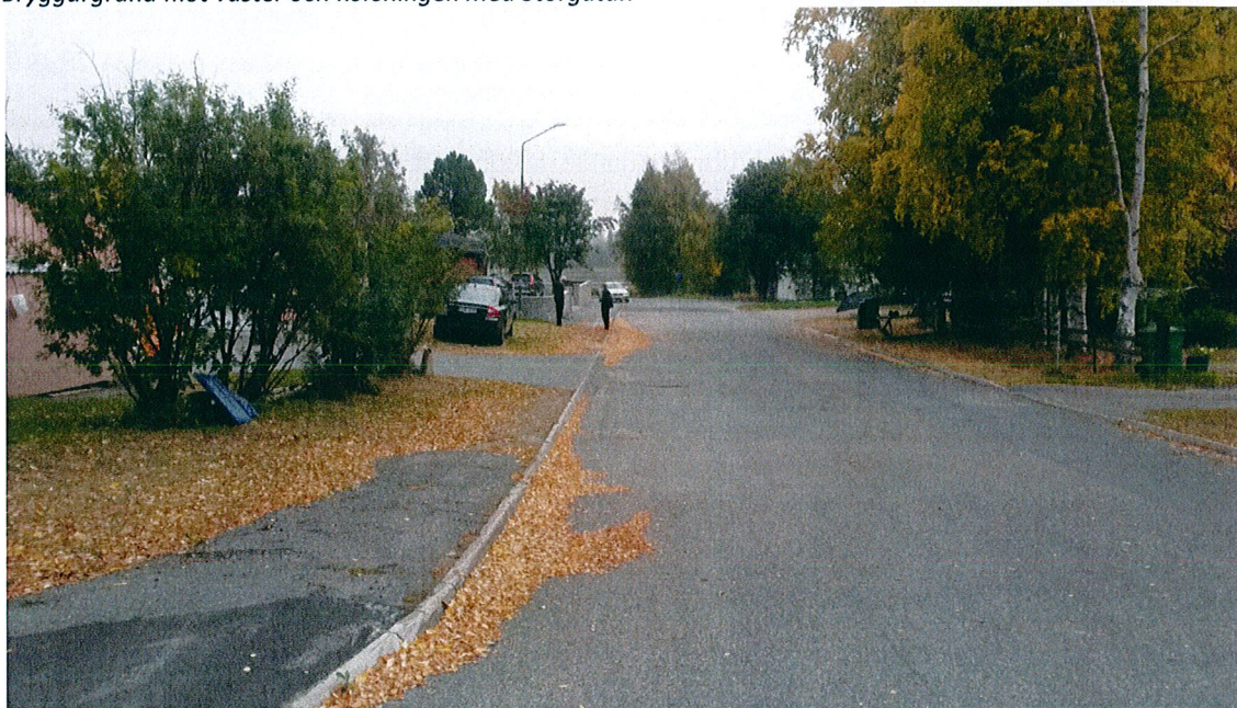
Bryggargränd mot öster och Torneälv