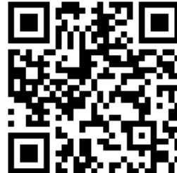
Mer om yrken inom ekonomi