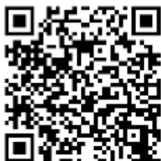
Försäljnings- och serviceprogrammet

Du lär dig att driva företag och projekt. Service, bemötande, kommunikation och hållbarutveckling är centralt i utbildningen. Mötet med kunden sätts i fokus och du lär dig att sälja och presentera produkter på ett proffsigt sätt.